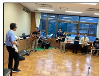
本番に向けて、先生たちの練習にも熱が入ります!