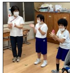
「♪もったいない音頭」です。さあ、皆さん一緒に手拍子を！