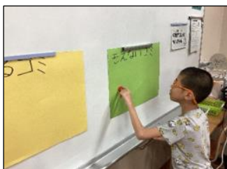
プラスチックごみはこっちだね！

最後に全員で「♪もったいない音頭」というダンスを踊りました。今後も、日常生活の中で身近な「もったいない」を探し、様々な物を大切にしようとする気持ちをさらに育てていけるよう指導します。