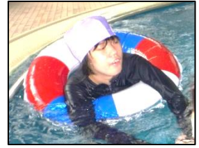
ぶかぶか浮いてニコニコ笑顔。水の中って楽しい！

久しぶりのプールに最初は緊張した様子も見られましたが、ゆっくりと水に浸かってしばらくすると、すぐに慣れることができました。浮き輪などの浮き具を使い、水にプカプカと浮いたり、丸いプールの中を指導者の誘導でゆっくりと周回しながら水の中を移動したりしました。水の抵抗を感じたり、水に浮く感覚を味わったりしながら、水と触れあう心地よさをたっぷりと味わうことができました。