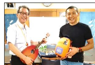
今後の教育活動でたくさん活用させていただきます。

医療法人秀仁会西舞鶴さくら眼科クリニック様から、ホワイトボード、AED、一五一会(ギター)を寄贈していただきました。心より感謝申し上げます。