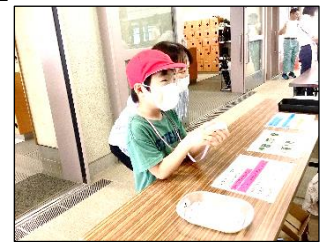
高等部のお兄さんお姉さんの目を見て「ブロッコリーください。」と伝えられました。

少し緊張している様子の児童もいましたが、受付で注文票を渡し、お財布からお金を出して、「〇〇の苗をください。」「ありがとう。」を上手に伝えて購入することができました。渡された苗を優しくそっと手に持ち、うれしそうに眺める様子が見られました。教室へ戻ってから、早速自分の植木鉢に苗を植え替え、収穫への期待で胸がいっぱいの児童たちでした。今後も水やりや肥料やりを行い、植物の成長を観察しながら育てることや食べることへの興味・関心を深められるよう指導します。