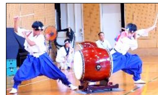
堂々と叩くことができました!