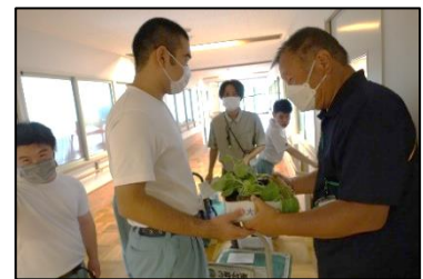
お客さんにしっかり両手で手渡します。