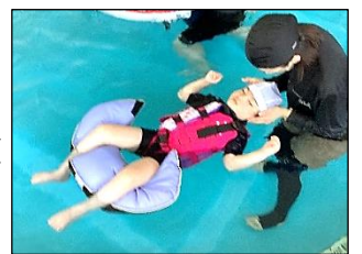
水の揺れや浮力を全身で感じて浮いています。股関節まわりの力が上手に抜けています!

外プールのグループはプールサイドやビート板を使ってバタ足練習、水面に顔を浸けてフープくぐり、水底に沈んだ魚やリングを潜って探すなどの活動を行いました。最初は水に顔を浸けたり潜ったりすることを怖がる児童もいましたが、口まで→鼻まで→頭まで…とスモールステップで練習しました。「自分もできるようになりたい!」という強い気持ちで、お家の人と一緒に風呂で練習してきた児童もいました。最後の水泳学習で練習の成果を発揮することができ、水に慣れたり水中で活動したりすることへの自信が付いた様子が見られました。