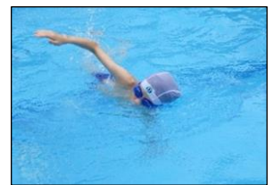
他のグループでは、けのび・バタ足・息継ぎ・クロールなど、それぞれの実態に応じて少し難しい課題にもチャレンジしました！