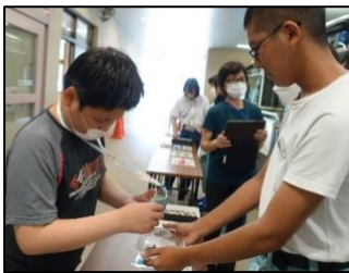
「いらっしゃいませ！」大きな声で挨拶！

また、会場の準備や後片付けも全て自分たちで行いました。友達と言葉を掛け合いながら長机を運んだり、苗箱を慎重に運んだり、半日を通して意欲的に活動できました。