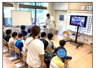
画面を見ながら、池内小学校の友達と意見交換をリモートでしています。

10月に実施予定の共同作品作りに向けて、5・6組の児童が池内小学校の5年生とリモート会議をし、作品名を一緒に考えました。それぞれの学校で事前に考えてきた作品名を出し合い、その中から良いと思うものに投票しました。その結果今年度の合同作品名は『すてきな木』に決まりました。それぞれの学校で準備を進め10月の交流学習で作品を完成させていきます。意見が出てきたときや投票のときには拍手をしてお互いの意見を尊重することができ、よい交流の機会となりました。