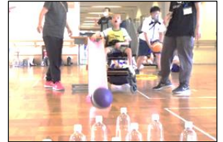
スロープを使ってボールを転がしました。