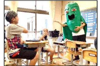
野菜マンと一緒に、野菜を食べることの大切さを学びました。

8月31日(木)は、「8(や)3(さ)1(い)」で「野菜の日!」この日の給食メニューは夏野菜がたっぷり入ったキーマカレーとナン、そしてフルーツヨーグルトでした。給食の時間には、万願寺とうがらしにふんした野菜マンが小学部の各教室を回り、子どもたちは野菜マンと触れ合ったり一緒に写真を撮ったりしました。また、好き嫌いなく野菜をしっかり食べると体の調子が良くなることなど、いろいろな野菜を食べることの大切さを教わりました。最後は野菜マンと一緒に、「野菜を食べて、元気もりもり〜!」の合言葉で盛り上がり、食への意識が高まるとてもよい機会となりました。