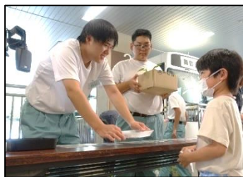
みんなに笑顔で接客します！