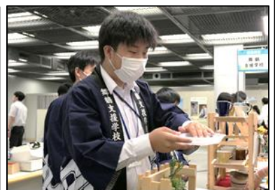
開店！お客様がたくさん来られて、緊張しました！